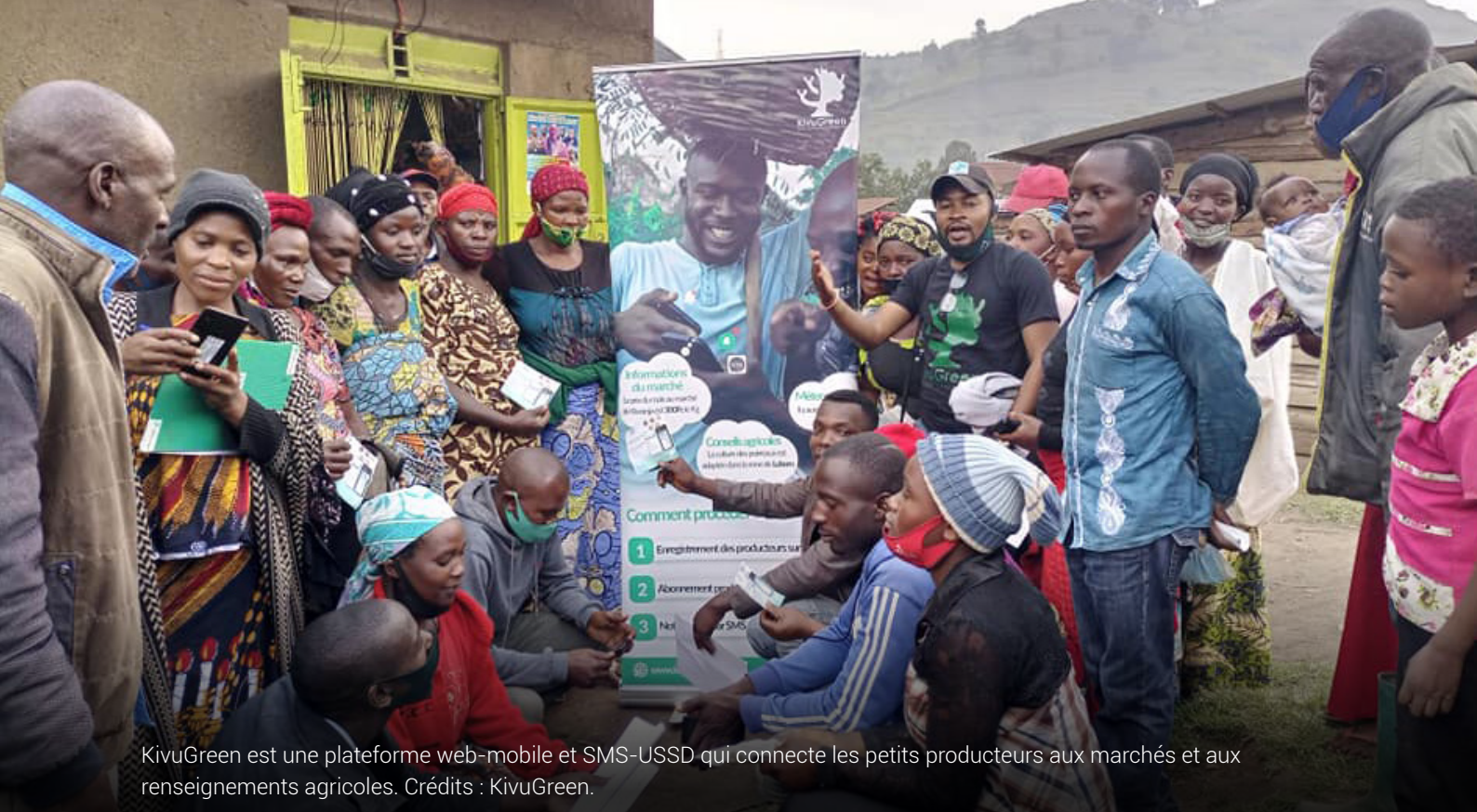
KivuGreen est une plateforme web-mobile et SMS-USSD qui connecte les petits producteurs aux marchés et aux renseignements agricoles.