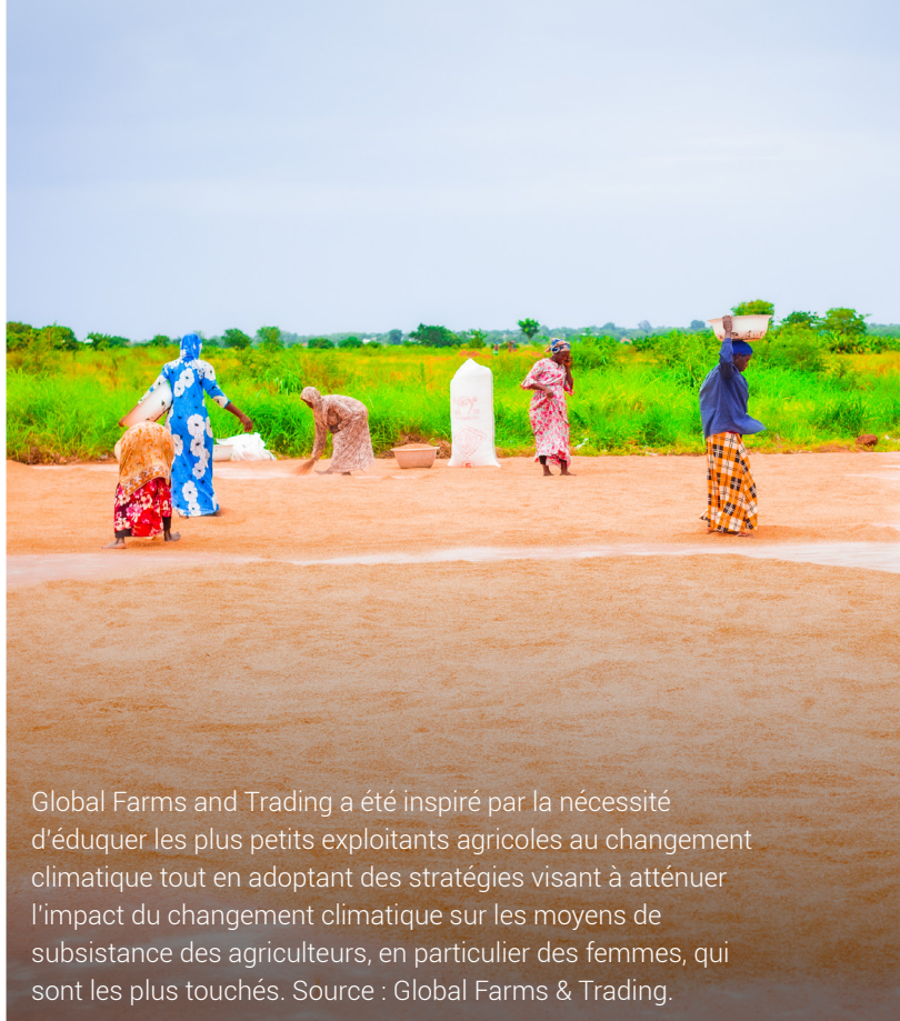
Global Farms and Trading a été inspiré par la nécessité d'éduquer les plus petits exploitants agricoles au changement climatique tout en adoptant des stratégies visant à atténuer l'impact du changement climatique sur les moyens de subsistance des agriculteurs, en particulier des femmes, qui sont les plus touchés.