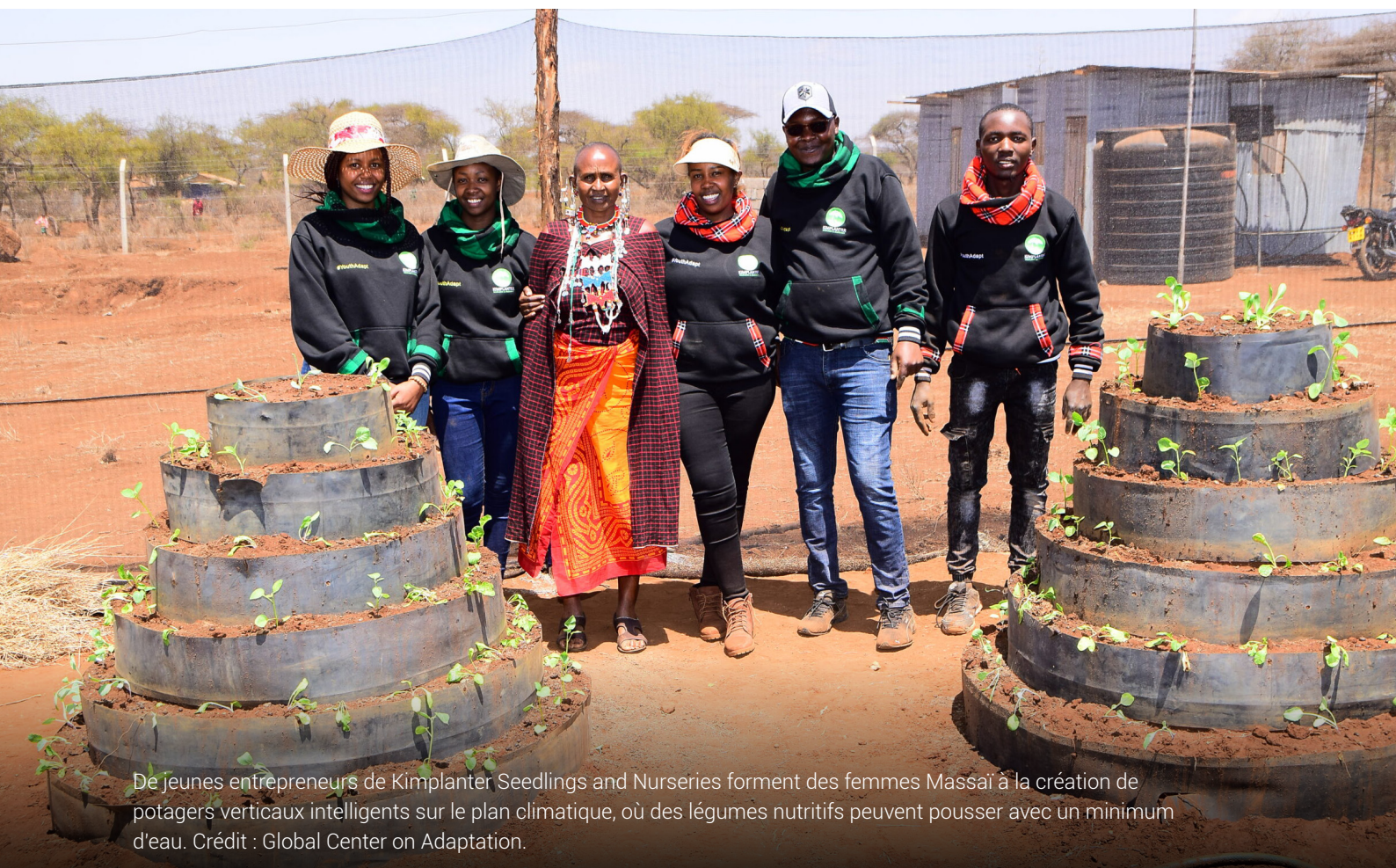
De jeunes entrepreneurs de Kimplanter Seedlings and Nurseries forment des femmes Massai à la création de potagers verticaux intelligents sur le plan climatique, où des légumes nutritifs peuvent pousser avec un minimum d'eau.